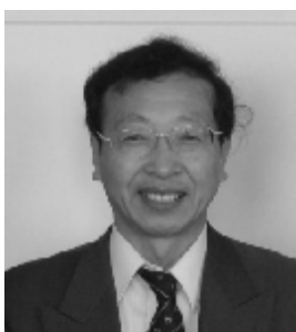
Проф. Тошинори Кимура

Как я уже отмечал в Информационном бюллетене СИГР №89, даже несмотря на то, что важность таких мировых проблем как обеспечение продовольствием и энергией, охрана окружающей среды и глобальное потепление как никогда ранее расширяет потребность в активной деятельности СИГР, стагнация мировой экономики отбрасывает отчетливую тень на финансовое положение СИГР. Ярким примером этому рост числа членов, которые годами не платили свои членские взносы, и прекращение поступления добровольных пожертвований и заказов на рекламу от промышленности. Кроме того, мы столкнулись со значительным падением курса обмена доллара США и евро и японской иены, и Великое восточно-японское