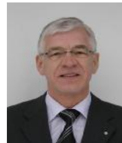
Проф. Сорен Педерсен

Мое первое задание – это назначение членом Рабочей группы СИГР по микроклимату в животноводческих помещениях при Секции II СИГР, на первом заседании в Швейцарии в 1977 году. Учреждение такой Рабочей группы, в которую вошло по одному представителю от 11 стран в составе Секции II, было обоснованное тем, что в 90-х годах каждая страна имела свои собственные правила расчета